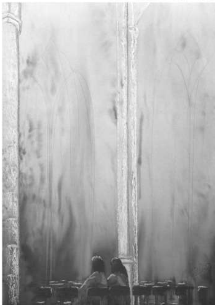
Bild: spirituelle Kunst von Michael Willfort, Galerie: www.kunst2day.de

Wo es finster bestellt ist in uns selbst, in der Kirche und in dieser Welt, sehnen wir uns nach dem Licht. Wo alles verhärtet ist in Hass und Kälte, sehnen wir uns nach Liebe und Wärme. Wir brauchen Gottes Geist in uns selbst, in der Kirche, in der Welt. Wir brauchen Pfingsten.